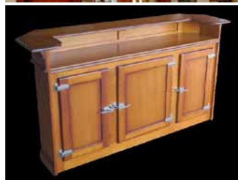
Le ciel de bar, de même que la desserte sont en option